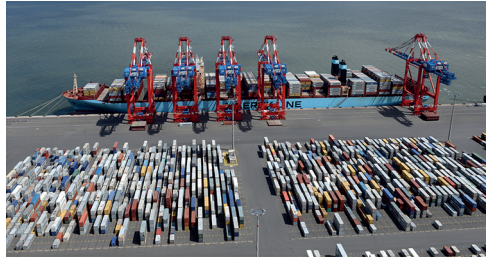
Left: Straddle Carrier in action Above: Handling of a ship in the container terminal