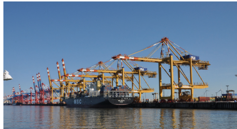
Links: Dynamik in der Hafenlogistik, Foto: shutterstock | Oben: Containerterminal-Bremerhaven, Foto: Sabine Nollmann