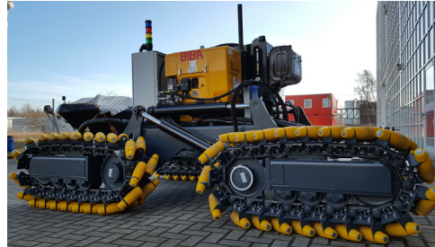
Links: LaMA – Last Mile Assistant Robot im DHL Robotics Challenge 2016, | Oben: Omniketten-Demonstrator