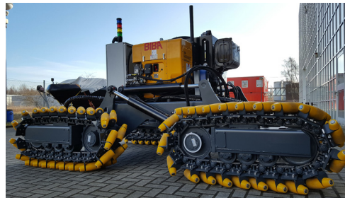
Left: LaMA – Last Mile Assistant Robot at DHL Robotics Challenge 2016, | Above: Omniketten-Demonstrator