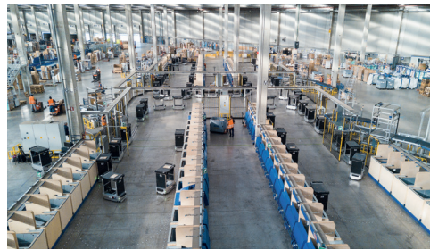
Links: Kollaborativer Sortierroboter | Oben: Im Sortierzentrum arbeiten kollaborative Fahrzeuge und Menschen Hand in Hand