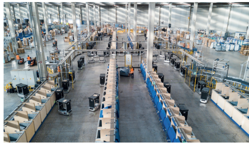
Left: Collaborative sorting robot | Above: Collaborative vehicles and humans work hand in hand in the sorting centers