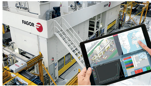
Links: Die LEVEL-UP Protokolle und Strategien, Grafik: CORE Innovation Centre | Oben: Beispiel für eine große Industrieanlage (LEVEL-UP Pilot)