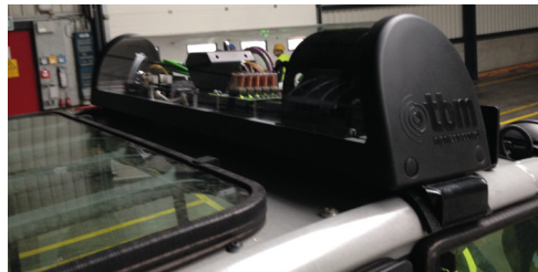
Left: Ceiling sensors create connections between vehicles and people in the warehouse, Graphic: tbm hightech control | Above: The sensor technology on the vehicle is connected to the vehicle control via an interface of the project partner tbm hightech control