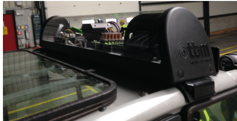
Links: Vernetzte Fahrzeuge und Personen in der Halle durch Deckensensoren, Grafik: tbm hightech control | Oben: Die Sensorik am Fahrzeug ist über eine Schnittstelle des Projektpartners tbm hightech control mit der Fahrzeugsteuerung verbunden