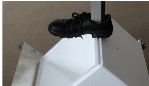
Left: FEM simulation results, Figure: Mises Stress Above: Testbed, Photo: Juan Daniel Arango