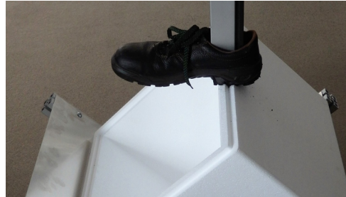
Links: FEM Simulationsergebnis, Grafik: Mises Stress Oben: Prüfstand